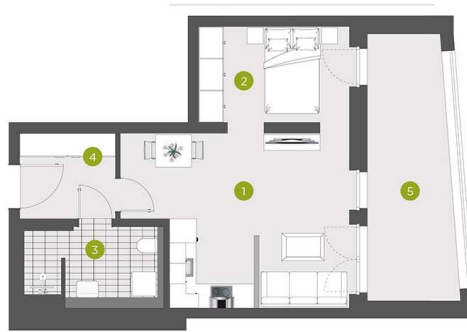
Standort im Gebäude/Geschoss