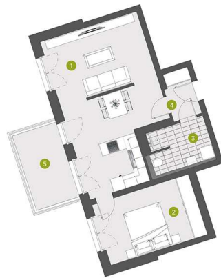
Standort im Gebäude/Geschoss